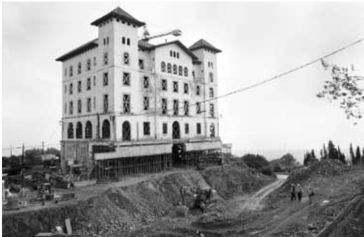
El hotel Florida, en su tránsito hacia el Gran Hotel Florida, ganará espacio por debajo

La visión desde la ciudad, con el Tibidabo, las atracciones y el edificio con forma de castillo de cuento, parece la de siempre. Pero no. Basta